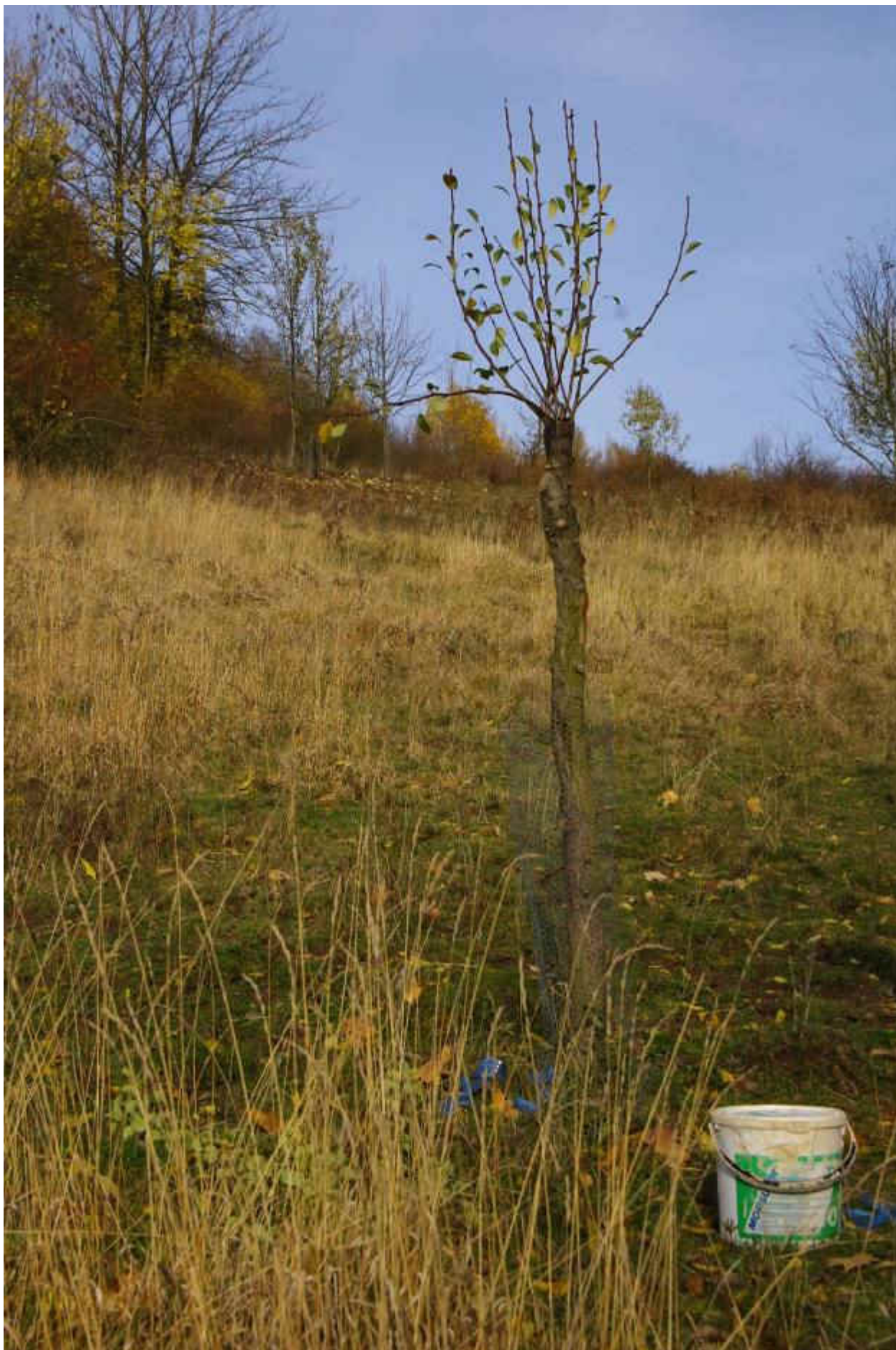
Foto: IMGP4779 roubovane plane.jpg