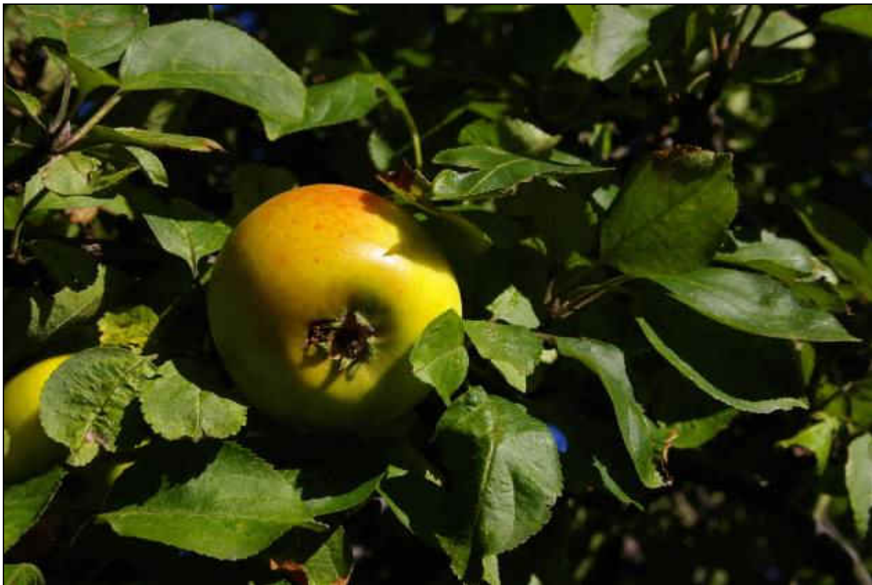
Foto: IMGP9061 Parména zlatá zimní Bor 3.jpg Projekt D 658/2008-Záchranné mapování ovocných stromů Karlovarska autor: Martin Lípa, říjen 2008 objekt: Parména zlatá v genofundové ploše - VKP alej u Boru