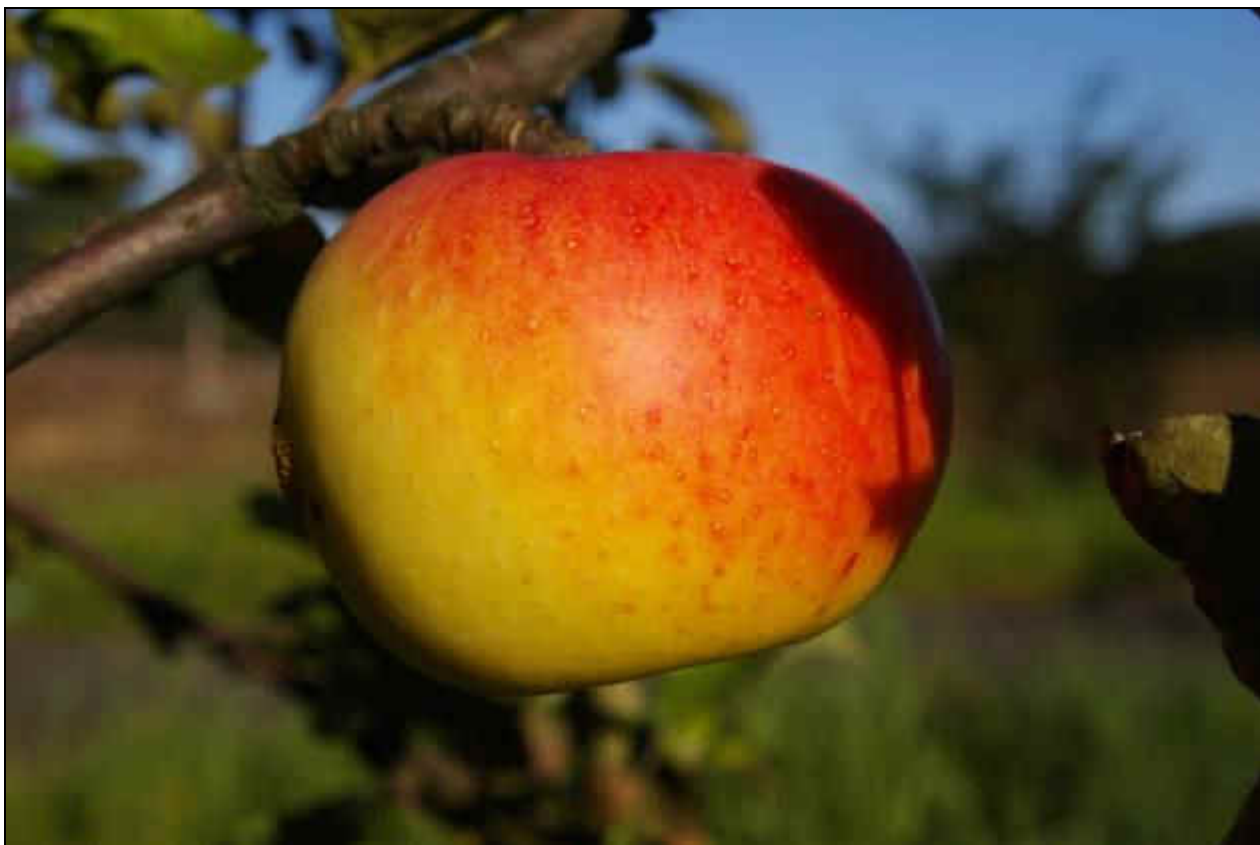
Foto: IMGP9072 Croncelské Bor 4.jpg Projekt D 658/2008-Záchranné mapování ovocných stromů Karlovarska autor: Martin Lípa, říjen 2008 objekt: Odrůda Croncelské v genofundové ploše - VKP alej u Boru. Velmi mrazuvzdorná odrůda jabloní německého původu.