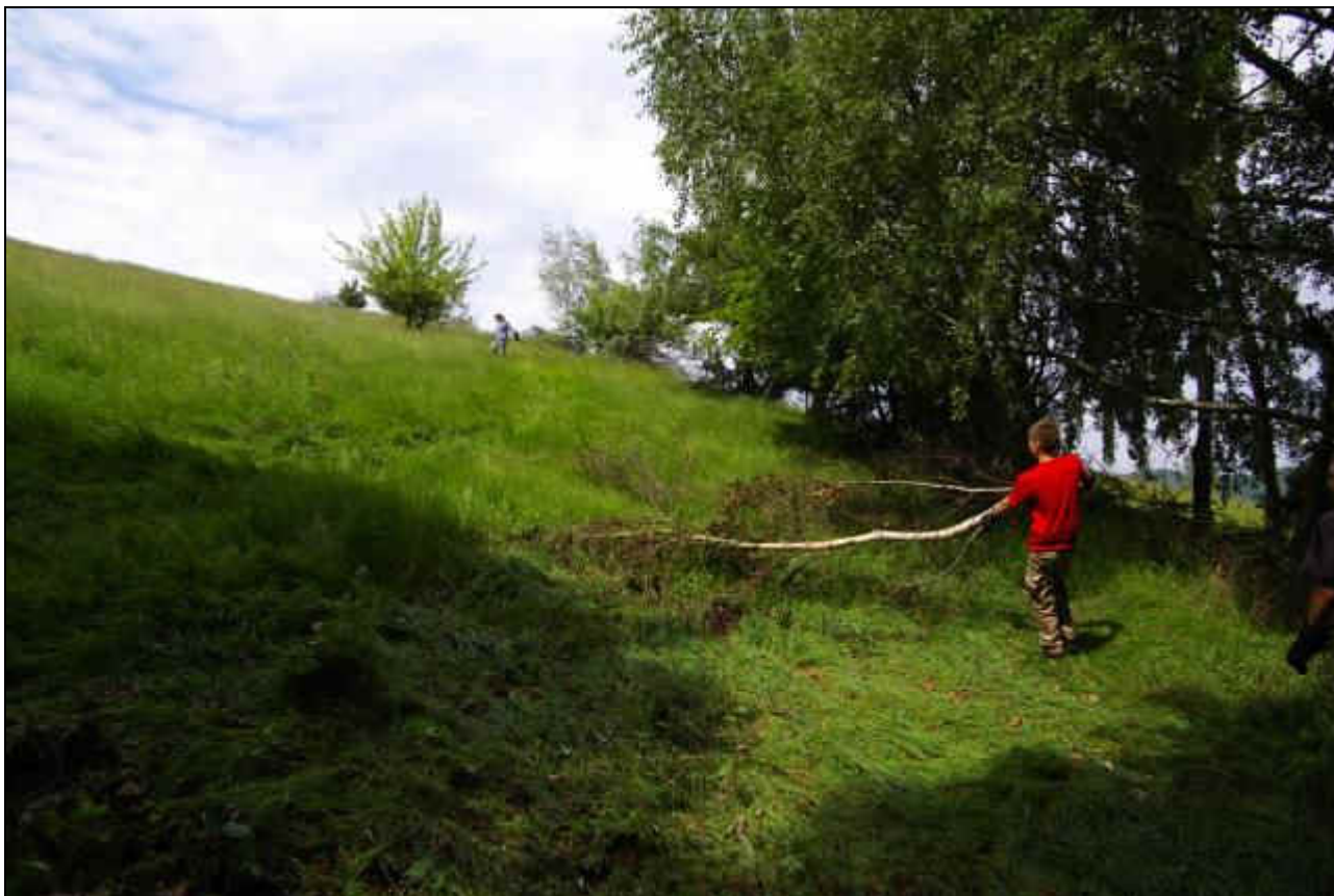
IMGP2358_uklid_Smi.jpg červen 2008

Projekt č.: 320805 - Rozvoj Pozemkového spolku Meluzína v roce 2008 objekt: práce na lokalitě VKP Pastviny u Srní