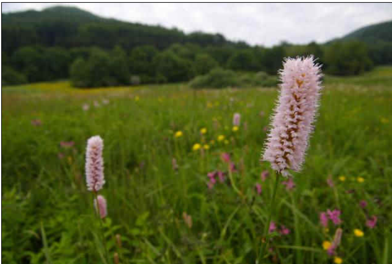
IMG2225 Polygonum bistorta.jpg autor: Martin Lípa, květen 2008