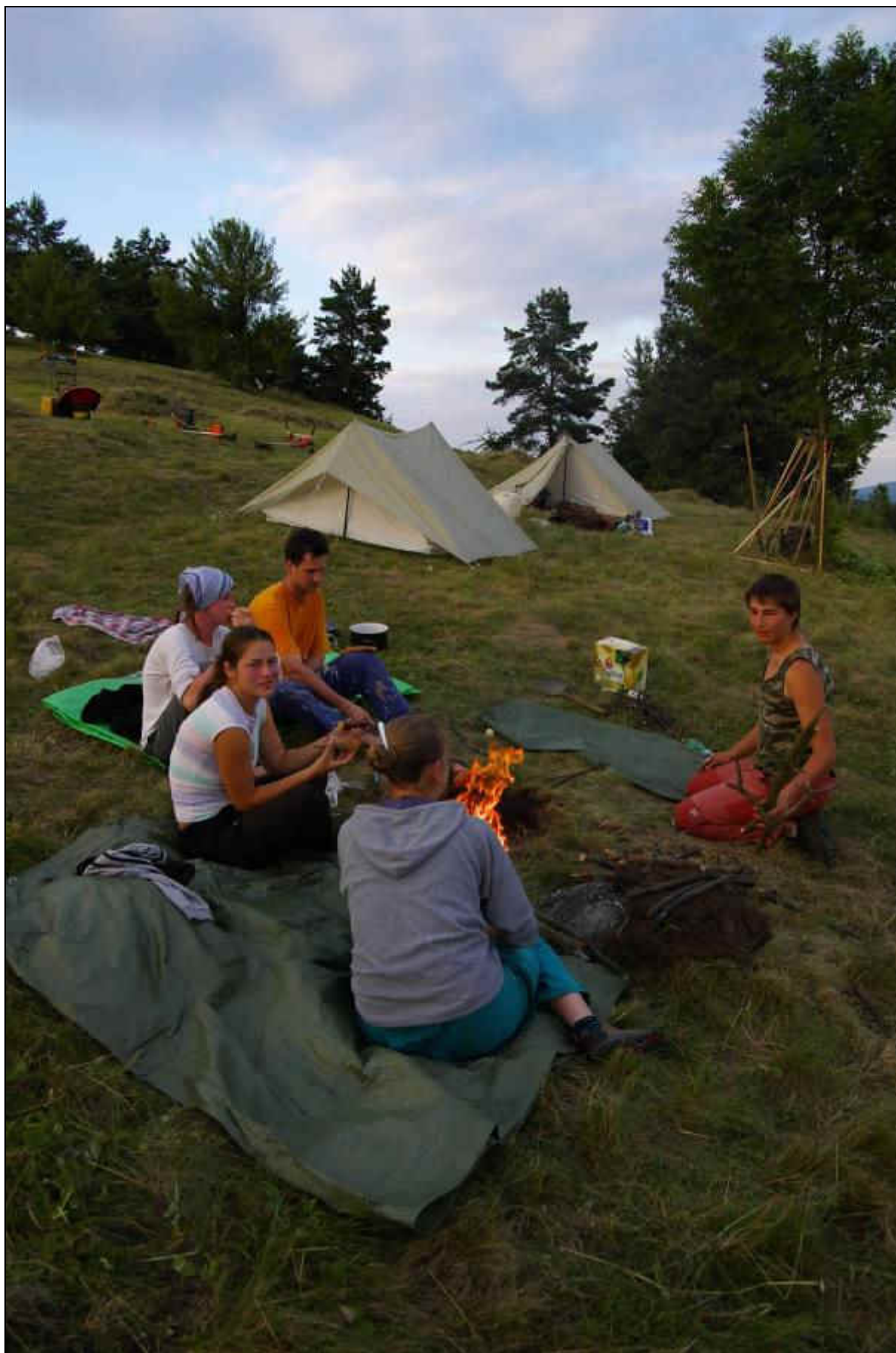
IMGP2737_hrabani_U_hrusky.jpg autor: Martin Lída, červenec 2008