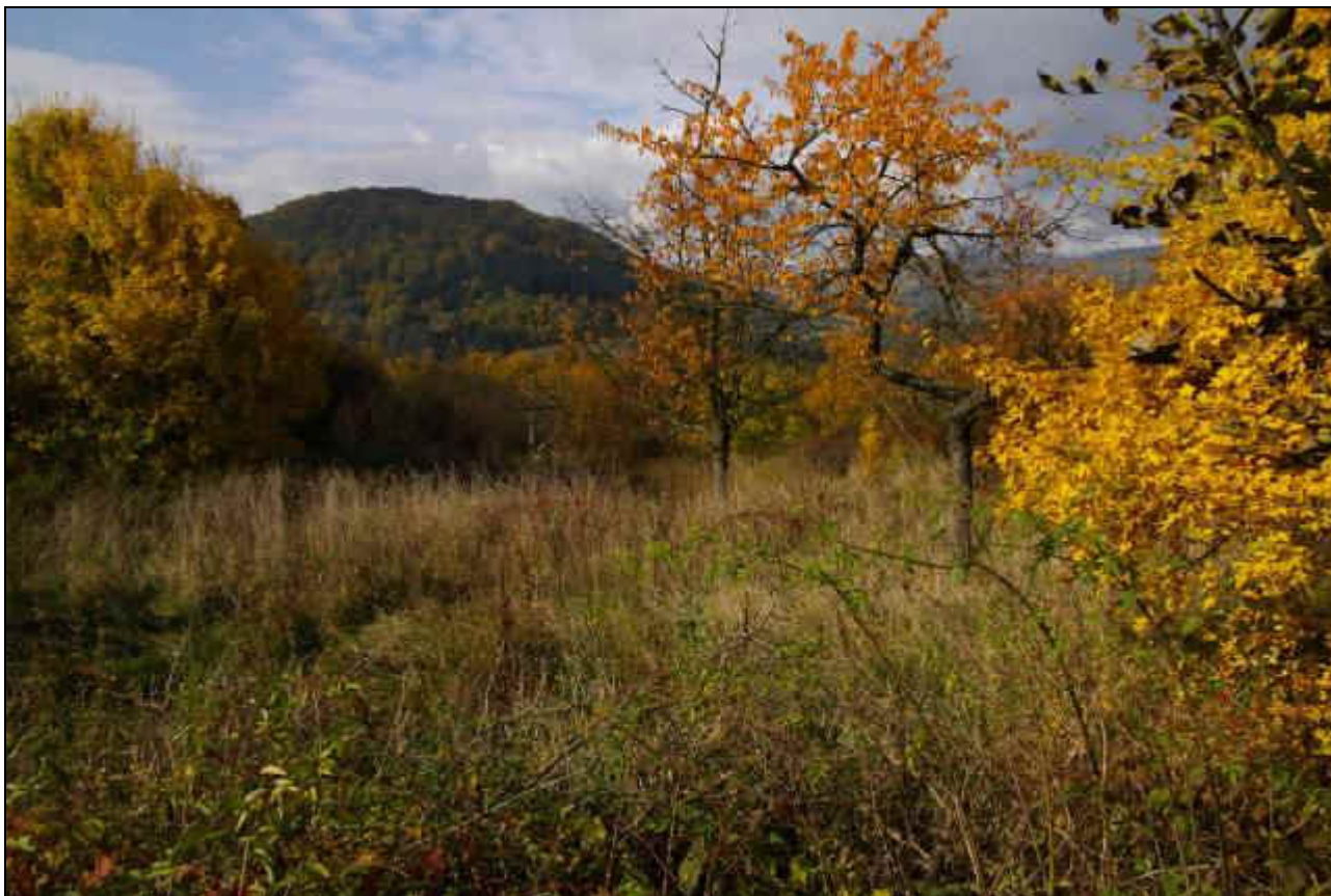
IMG4628_Jakubov_487_tresnovka.jpg autor: Martin Lípa, září 2008

Projekt č.: 320805 - Rozvoj Pozemkového spolku Meluzína v roce 2008 objekt: VKP Sady u Jakubova - průzkum společenstva ptáků