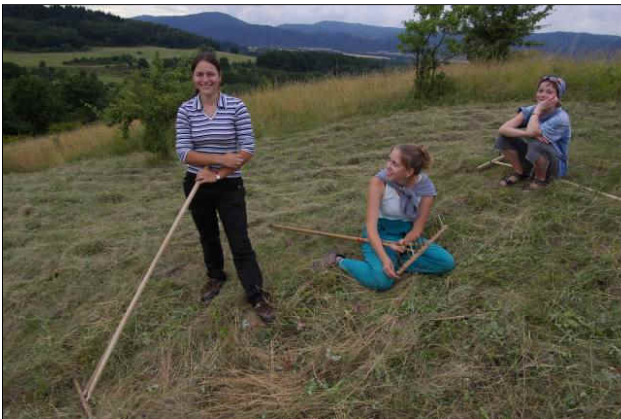
IMGP2730_hrabani_U_hrusky.jpg autor: Martin Lípa, červenec 2008

Projekt č.: 320805 - Rozvoj Pozemkového spolku Meluzína v roce 2008 objekt: práce na lokalitě VKP Pastviny u Srní