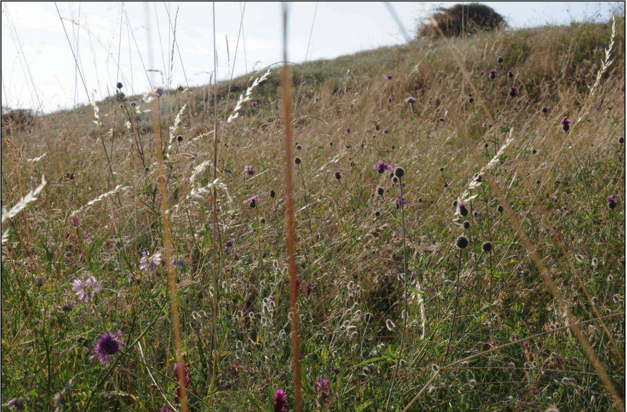
IMGP4146.jpg – druhově pestré louky jsou jedním z hlavních témat práce Pozemkového spolku Meluzína – lokalita U hrušky červenec 2013