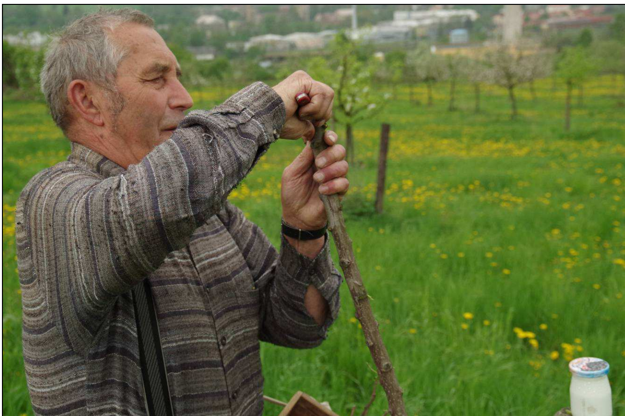
IMGP2250.jpg Záchrana starých krajových odrůd je druhým hlavním tématem pozemkového spolku. Duben 2013