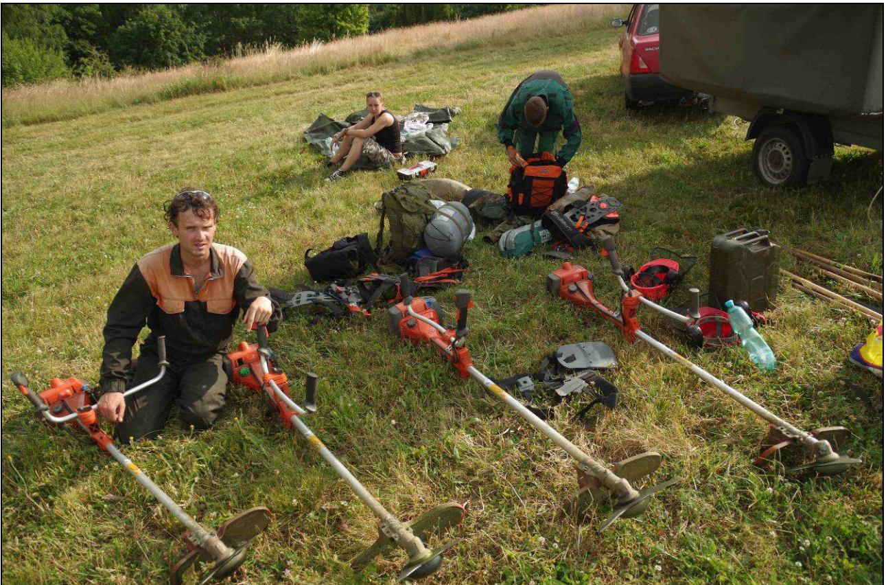
IMGP4188.jpg Pozemkový spolek Meluzína zajišťuje především práce s drobnou mechanizací umožňující detailní péči na lokalitách. Červenec 2013