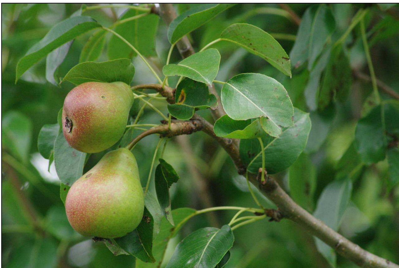
IMGP5913.jpg Jednou z téměř zmizelých odrůd je Muškatelka turecká – Zbuzanka. Pozemkový spolek Meluzína ji uchovává ve svých genofondových plochách. Srpen 2013