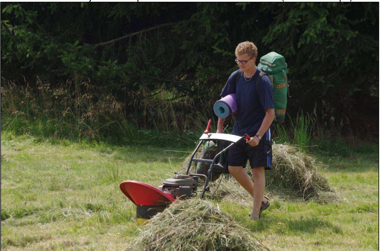
IMGP4510.jpg Hlavní objem práce zajišťují dobrovolníci z řad zemědělských středoškoláků. Červenec 2013