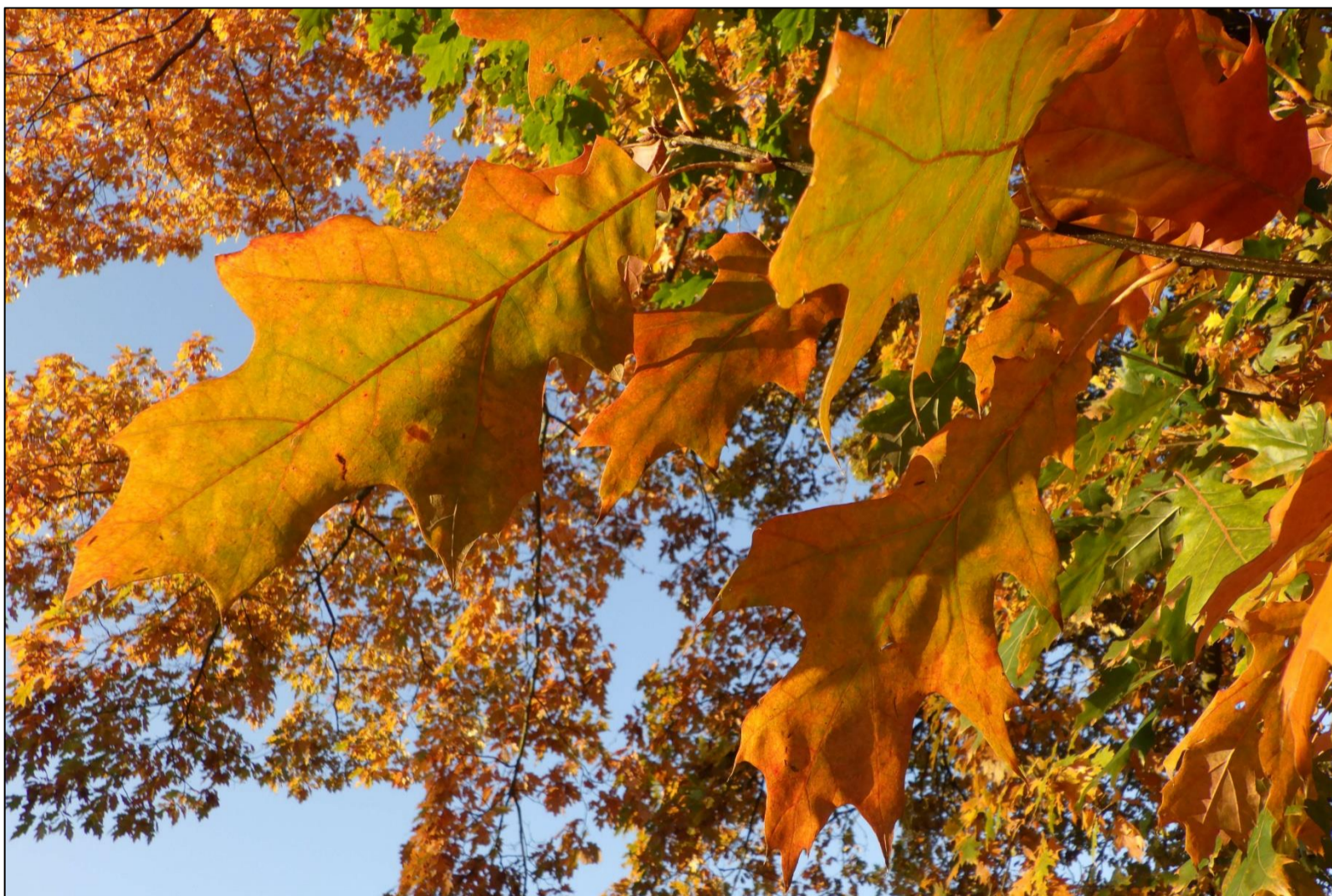
Až opadá listí z dubu ... a ono už opadlo